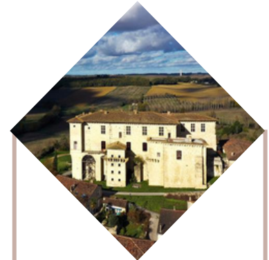
Château Lavardens 32 569