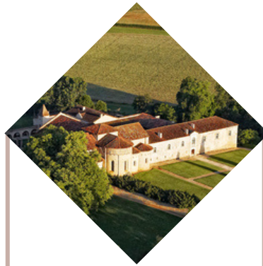
Abbaye de Flaran Valence-sur-Baïse 37 593